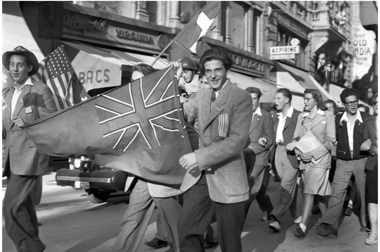
Lausanne am Kriegsende

Vor 75 Jahren hat der 2. Weltkrieg, die schlimmste menschliche Katastrophe des 20. Jahrhunderts, in Europa sein Ende gefunden. Ausgelöst durch die verbrecherische nationalsozialistische Bewegung in Deutschland, hat dieser Krieg Millionen Menschen das Leben gekostet, unendliche Zerstörungen und Flüchtlingselend gebracht und das Miteinander-Leben der Völker erheblich zerrüttet; dazu der Völkermord an Millionen Juden und anderen