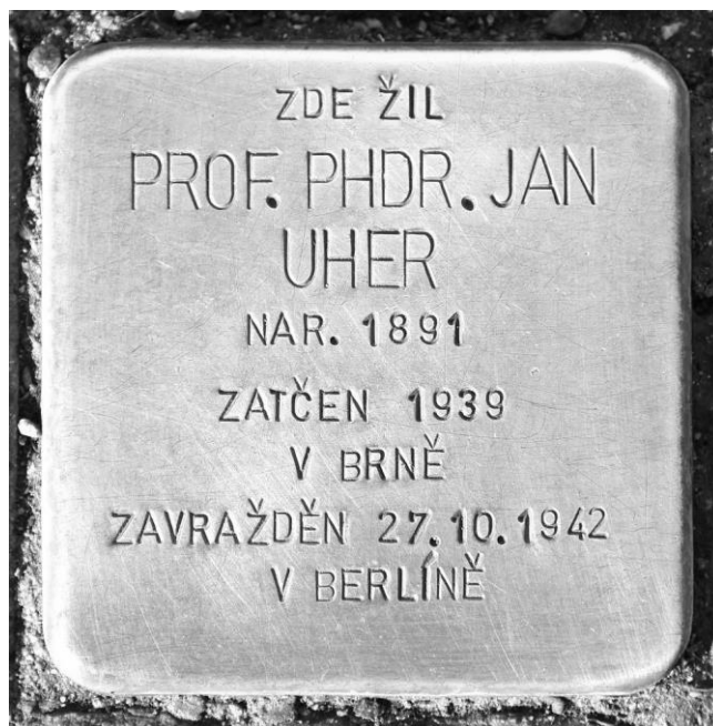
Stolperstein in der Rudišova 161/6 in Brno (Brünn)