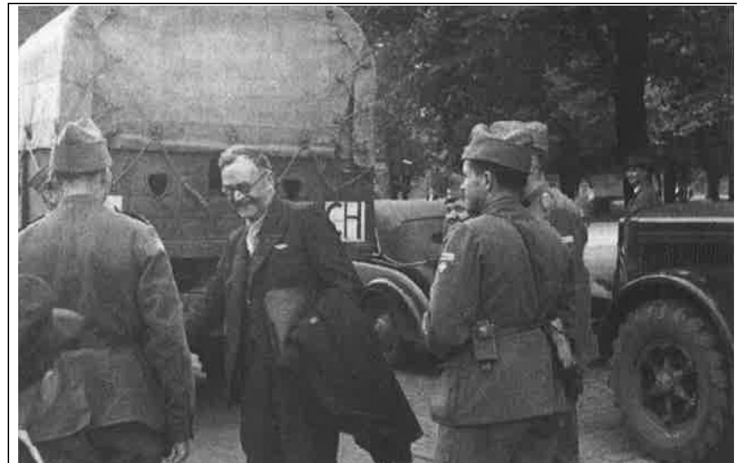
Schweizer Hilfslieferung für deutsche Studierende bei der Universität Bonn (1946), Karl Barth in der Mitte