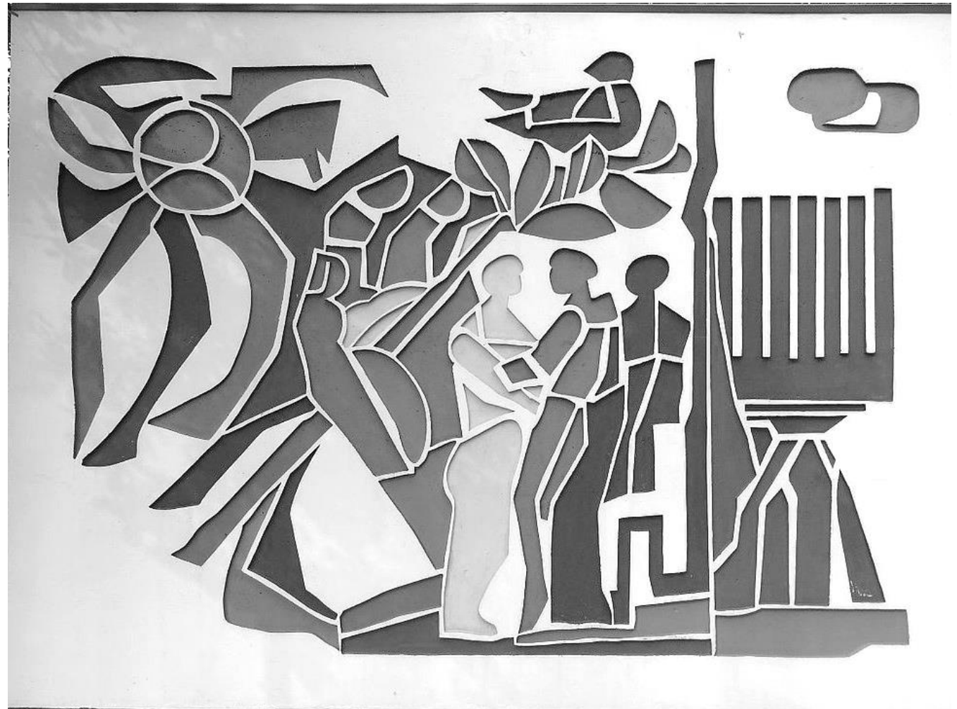
Mauerrelief von Lex Horn in der Gedenkstätte Kamp Amersfoort

Kurz vor seiner Hinrichtung durfte mein Vater meinen Bruder noch einmal eine Viertelstunde