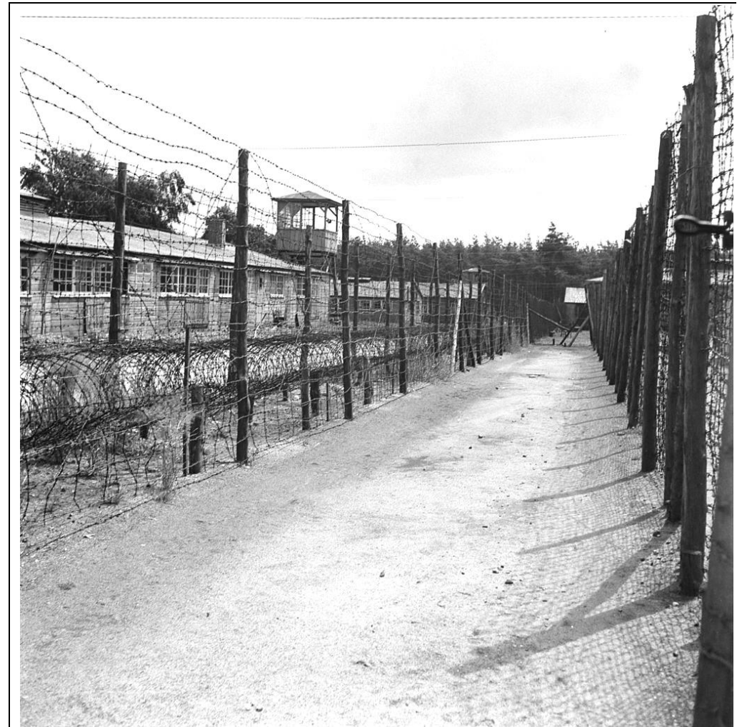
Baracken des Konzentrationslagers Amersfoort

Ich möchte hier nicht schildern, was er alles geleistet hat. Am 14. April 1942 wurde er mit 32 anderen verraten und verhaftet. Er wurde ins Konzentrationslager Amersfoort gebracht, wo er schlimm misshandelt und körperlich ganz