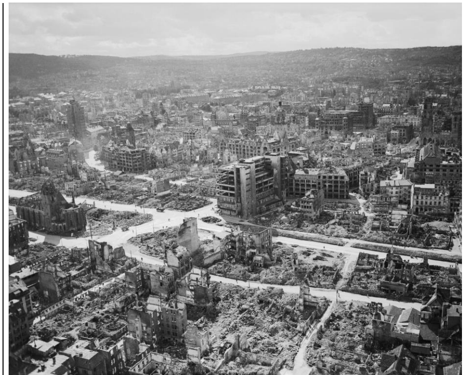
Luftbild des zerstörten Stuttgarter Zentrums, aus niedriger Höhe aufgenommen wohl nach Kriegsende 1945 etwa oberhalb der Kreuzung Char-lottenstraße/Olgastraße