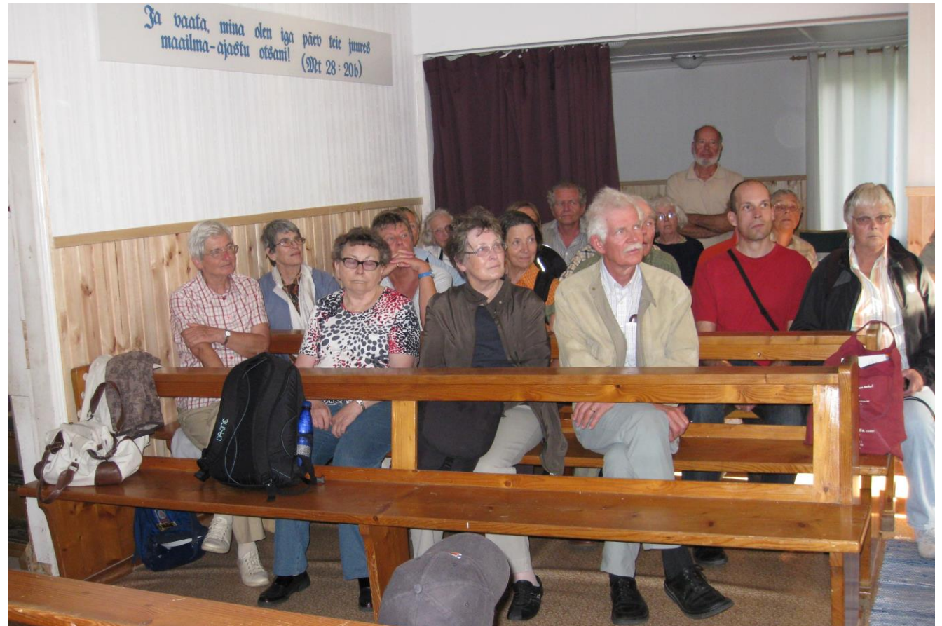
Gemeinde, ganz gespannt – hier im Saal der Brüdergemeinde in Saku / Estland

Es zeugt von stark eingeschränkter Wahrnehmung, wenn in dieser Hinsicht nur auf den Islam verwiesen wird, auch bei der Frage nach