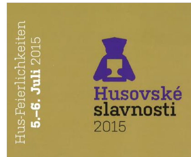
Titelblatt der offiziellen Gedenkveranstaltungen in Prag.

Die Brüder-Unität war also nicht „hussitisch“ in dem Sinne, dass sie direkt an Jan Hus angeknüpft hätte. Mit der Zeit, als die Brüder im Kontakt mit den anderen Kirchen ihren Glauben durchdachten, kam sie aber zu der Erkenntnis, dass das, was Jan Hus getan hatte, Teil des Wirkens Gottes mit der Kirche war, Teil der Geschichte der Erneuerung der christlichen Kirche und so auch Teil ihrer eigenen Geschichte, der Geschichte eben der Jednota Bratrská.