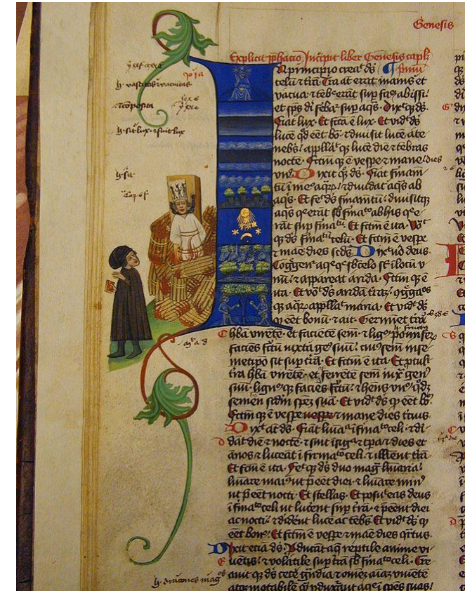
Martinitz-Bibel um 1430:

Verbrennung des Jan Hus. Die Figur neben ihm stellt vermutlich Peter von Mladoňovice dar.