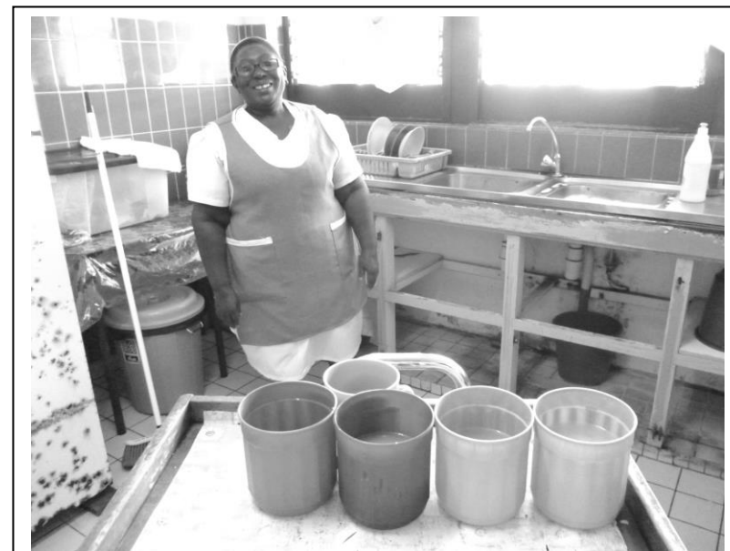
Stationsküche im Huize Albertine

Für die Diakonie wird das ganze Jahr hindurch immer wieder in den Gemeinden zu Spenden aufgerufen. Das Geld, das dort zusammenkommt, wird dazu verwendet, bedürftigen Menschen vor Ostern und vor Weihnachten ein Nahrungsmittel-Paket zu bringen. In der gegenwärtigen ökonomischen Krise ist das äusserst schwierig. Der surinamische Dollar ist im Jahr 2016 massiv abgewertet worden und die Kosten für Grundnahrungsmittel sind jetzt 4-5 Mal so hoch. Gleichzeitig werden Pensionen gekürzt oder über einen längeren Zeitraum einfach nicht ausgezahlt. Das hat die Durchführung des Bigisma die deutlich erschwert.