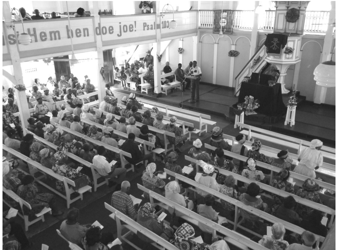
Gottesdienst in der Grossen Stadtkirche in Paramaribo