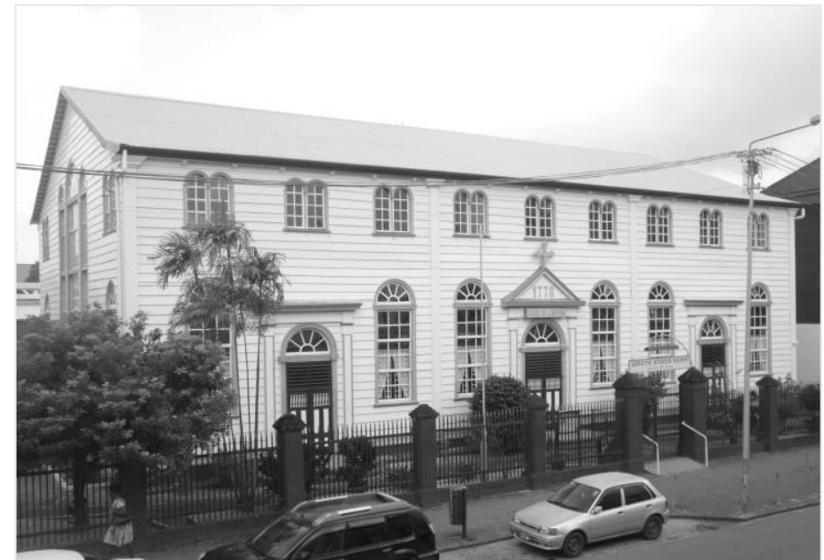
Grosse Stadtkirche in Paramaribo