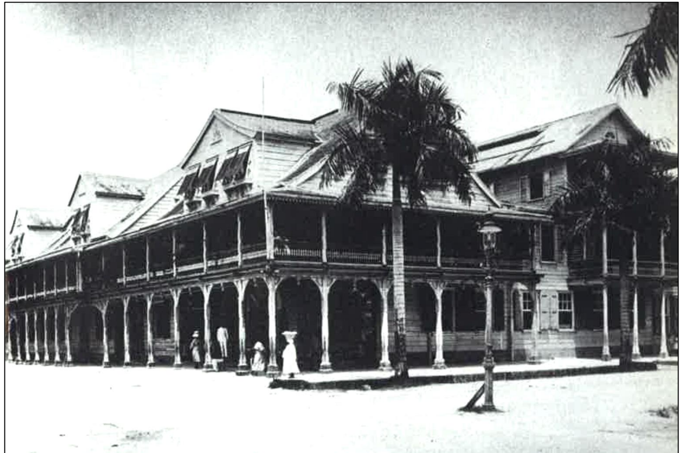
Das Warenhaus in Paramaribo (um 1900)