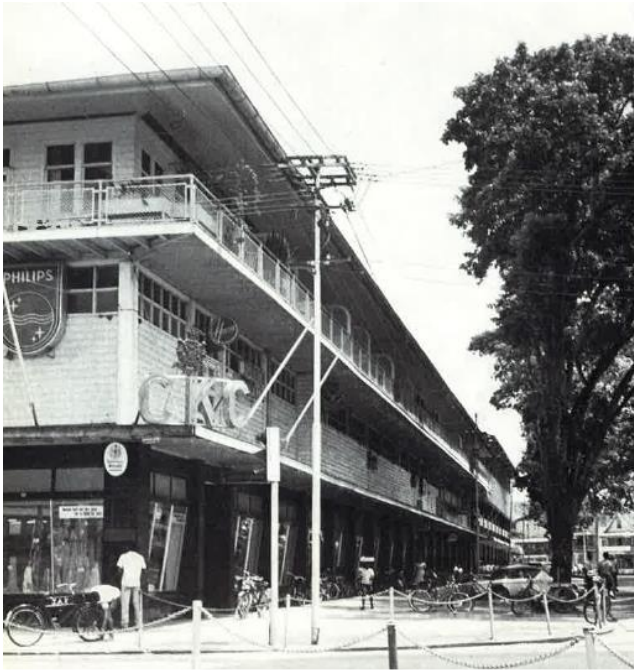
Das ehemalige Warenhaus 1967

Die Synode 1967 hatte auch entschieden, dass die Gewinne von CKC und den Geschäftsanteilen auf den niederländischen Antillen an die Arbeit der gesamten Brüder-Unität weitergegeben werden müssen. Der Vorstand der MCF hat über die Vergabe der Mittel zu entscheiden. Die Gewinne wurden stets mehr auf den Antillen erzielt, wo die Betriebe, die die MCF zu betreuen hatte, vom Aufschwung des Tourismus profitierten.