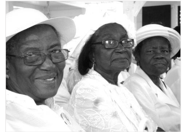
Schwestern vor dem Abendmahl