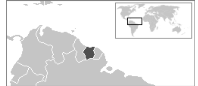
Die geographische Verortung Surinams