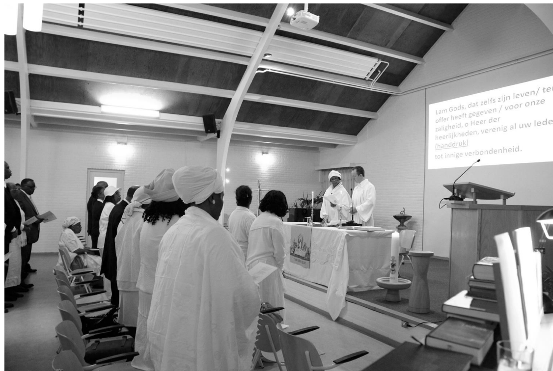
Abendmahlsfeier in Utrecht / NL

Die Feier endet mit einem Ausblick : Ein kurzer Wechselgesang drückt die Hoffnung aus, dass Menschen über alle Grenzen hinweg miteinander und mit Gott versöhnt das „große Abendmahl“ mit Jesus feiern werden. Dazu gehört auch die Sehnsucht nach Gemeinschaft am Tisch des Herrn zwischen Menschen unter-