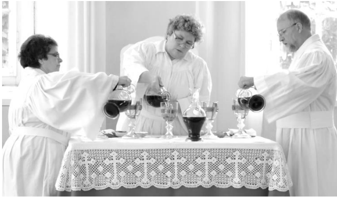
Abendmahlsfeier in der Gemeinde Herrnhut

Anschluss an oder integriert in einen Predigtgottesdienst gefeiert. Viele Gemeinden feiern es etwa alle zwei Monate. Trotz regionaler Unterschiede ist die gemeinsame Abendmahlpraxis der Brüdergemeine klar zu erkennen. Sie verbindet die Gemeinden der Europäisch-Festländischen Provinz miteinander und mit der Brüdergemeine weltweit.