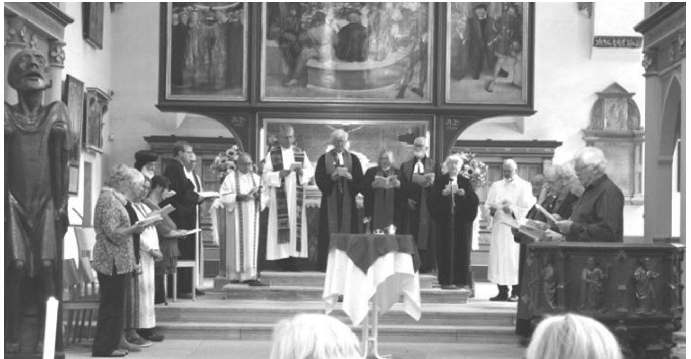
Lima-Liturgie-Feier am 28. August 2017 in der Schlosskirche Wittenberg mit dem Generalsekretär des ÖRK Olav Fykse Tveit, dem Ratsvorsitzenden der EKD Heinrich Bedford-Strohm sowie verschiedenen Bischöfinnen und Bischöfen aus verschiedenen Konfessionen als Zelebranten

Die Konkordie reformatorischer Kirchen in Europa, kurz Leuenberger Konkordie, entstand nach zwischenkirchlichen Lehrgesprächen 1973 im Tagungshaus Leuenberg in Hölstein bei Basel. Damit wurde die Kirchenspaltung zwischen den reformierten und den lutherischen Kirchen, den aus ihnen hervorgegangenen unierten Kirchen sowie den ihnen verwandten erstreformatorischen Kirchen der Waldenser und der Böhmisches Brüder beendet; es wurde gleichzeitig Kirchengemeinschaft unter den evangelischen Kirchen lutherischer und reformierter Prägung in Europa hergestellt. Sie ist somit das Gründungsdokument der Gemeinschaft Evangelischer Kirchen in Europa, die anfänglich Leuenberger Kirchengemeinschaft hiess.