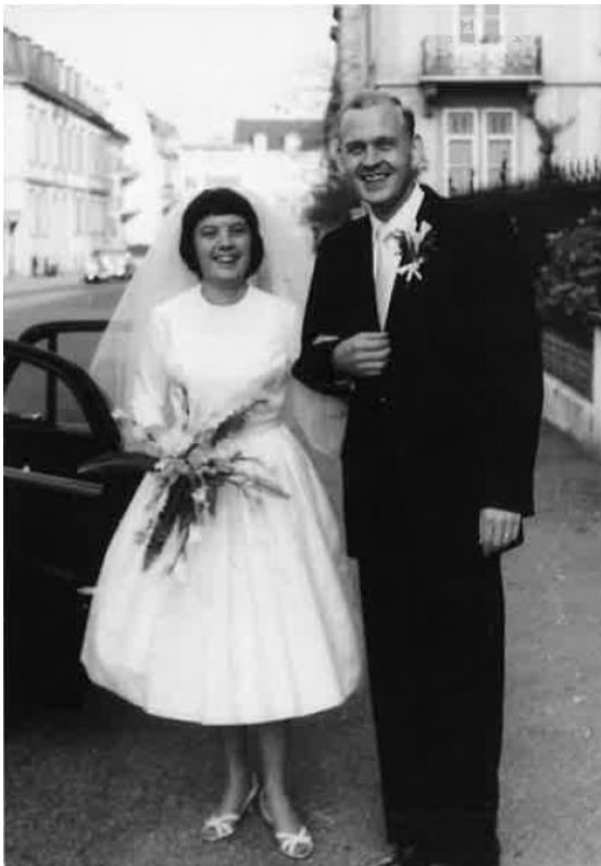
Hochzeit in Basel