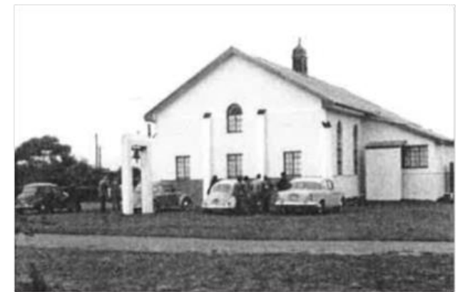
Kirche der Brüdergemeine in Fairview

Am ersten Sonntagabend nach der schweren Nachricht hielt ich im Gottesdienst eine Ansprache über Sacharja 4, 6 (nicht durch Heer oder Kraft, sondern durch meinen Geist). Dieses Wort wurde uns auch von anderen Geschwistern zugerufen und hat uns entscheidend weitergeholfen. Besonders hart trifft es unsere Geschwister in der Nebengemeinde Willowdene, die schon vor etwa 10 Jahren aus einer "location", wo sie mit Schwarzen zusammen gewohnt hatten, in einen Teil Fairviews umziehen mussten. Die Gefahr ist, dass die Leute verbittert oder gleichgültig werden, und dass die